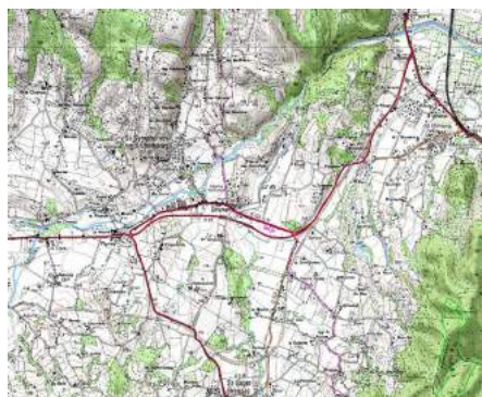
Plan situation Voie Douce de la Payre