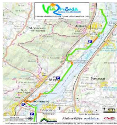
Plan situation ViaRhôna