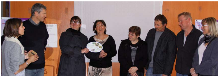
Les équipes participantes à l'événement de clôture du 25 mai 2013 à Villeneuve de Berg

Les deux équipes du territoire Berg et Coiron et Barrès-Coiron étaient au coude à coude lors du bilan intermédiaire, suivi de l'équipe de Privas qui a fait un travail remarquable avec le foyer des jeunes. C'est finalement l'équipe les