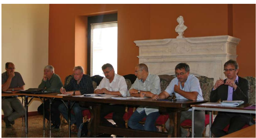
Les membres du COPIL du 23 avril 2013

Le comité de pilotage de lancement de l'étude d'OPAH RU du Teil s'est tenu le 23 avril dernier en présence de Monsieur Olivier