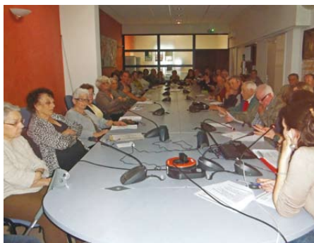
Réunion de sensibilisation organisée le 15 mai à Bourg-Saint-Andéol

Une cinquantaine de propriétaires, majoritairement avec un projet de travaux, est venue participer à ces 3 réunions d'information.