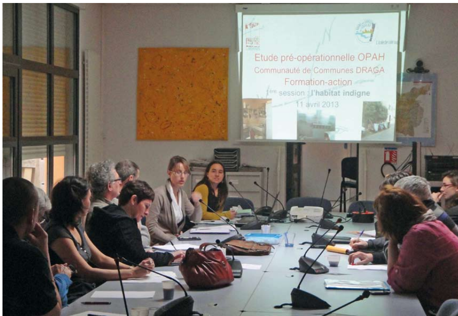
Formation habitat indigne du 10 avril à Bourg-Saint-Andéol

Dans le cadre des études d'Opération Programmée d'Amélioration de l'habitat conduites par les Communautés de communes DRAGA et Rhône Helvie, les élus bénéficient actuellement de sessions de formation portant sur les outils et procédures de lutte contre l'habitat indigne et notamment les mécanismes coercitifs de résorption de l'habitat insalubre et de restauration immobilière (RSD, ORI, RHI...). Des procédures qui pourront être mobilisées en phase d'OPAH.